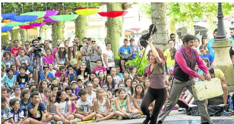
Circobaya, en un momento de la representación de 'El viaje de Miércoles'.

Afinando un poco más el dato de los profesionales, en esta oportunidad la presencia de castellanos y leoneses ha sido muy destacada, con un total de 108 entidades acreditadas. «Esto afianza el carácter de la Feria como punto de encuentro imprescindible para la profesión», sostienen. Además, 17 compañías de Castilla y León han participado en una cita que ha ofrecido 15 estrenos